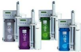
Системы Milli-Q Academic, Gradient, Biocell, Synthesis, Element на системы Milli-Q Advantage A10 или Milli-Q Referenc